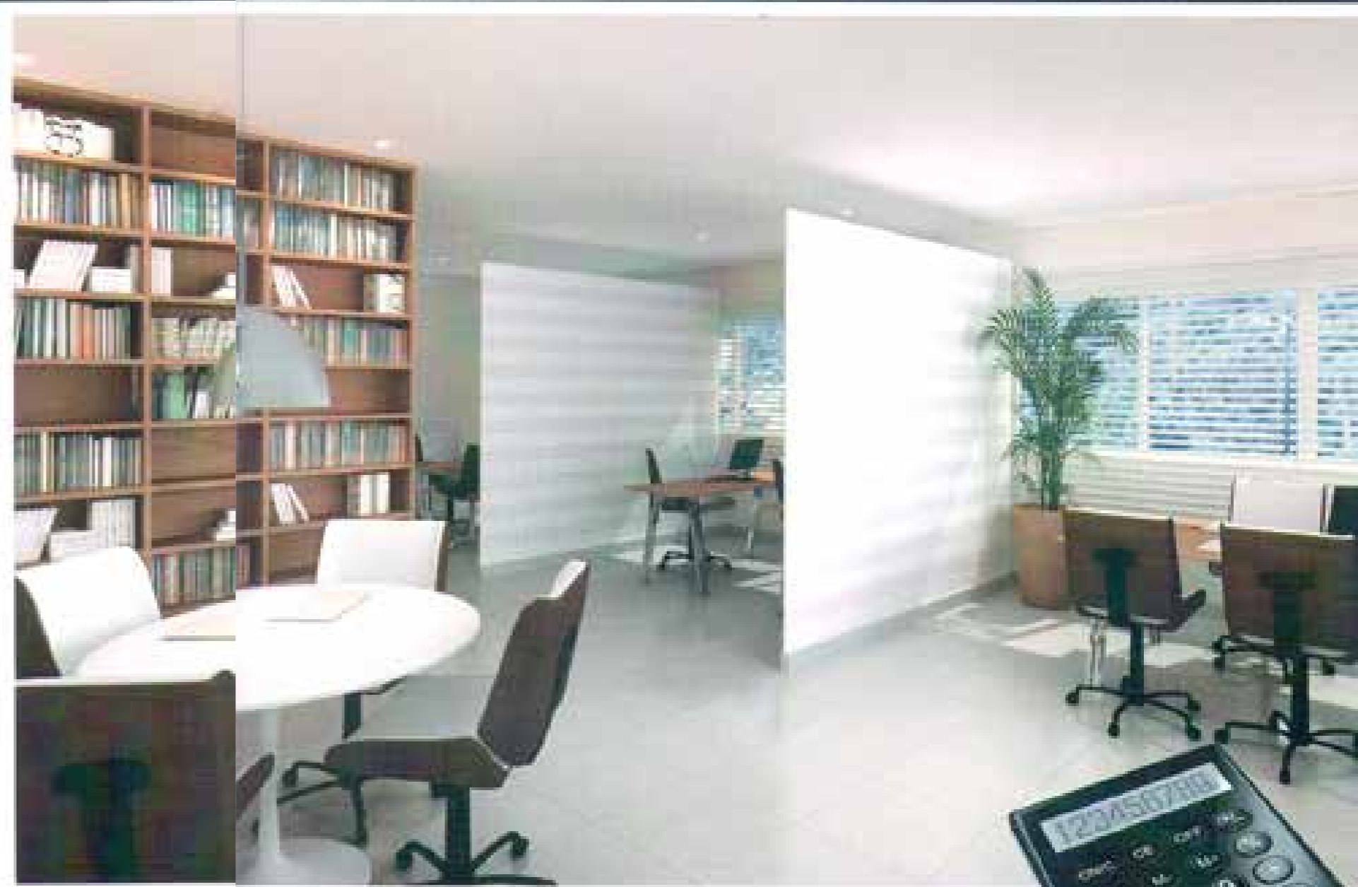
Proposta de mobiliário para a sala de reuniões final 1 com gabinete de direção. Os escritórios, áreas, pontos, corredor e sanitários de área comum são baseados em unidades de 2,00 metros lineares por 2,00 metros, sendo possível de ser adaptados a qualquer medida necessária para as condições.